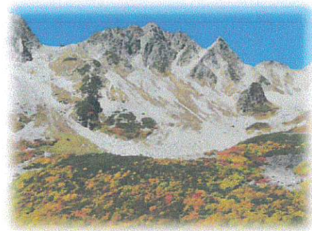
涸沢岳と涸沢カール