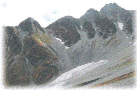
前穂高と涸沢カール