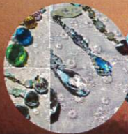
天然石を使った アクセサリーワークショップ