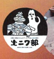
スタンプで自由にデザイン! コースター作りワークショップ